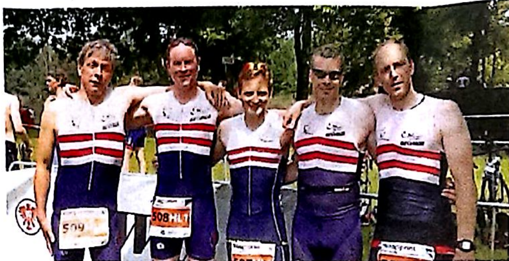
Mit Platz acht zufrieden: Das 1. Hessenliga-Team der TG Tria Rüsselsheim.